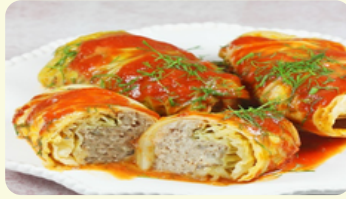
Golabki - Niños Envueltos 595RD

En salsa de champiñones, puré de papa y ensalada de repollo morado.