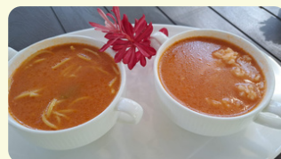
Pomidorowa 365 RD

Red beet soup served with mashed potatoe and boiled egg