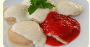
Strawberries pierogi 550RD

Served with fried onion, accompanied with coleslaw salad.