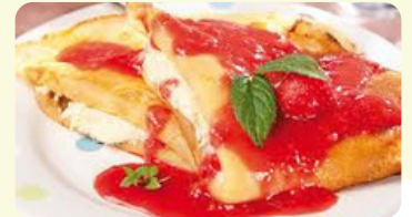
Nalesniki z truskawkami i serem 485RD

Very traditional and delicious pierogi served with onion and sour cream.