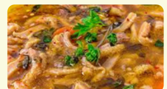
Flaki- Polish Tripe Soup 425 Rd