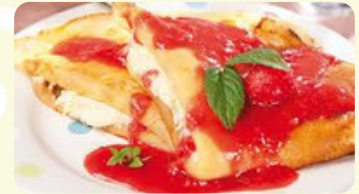
Nalesniki z truskawkami i serem 485RD

Bañado con cebolla sofrita y acompañado de crema agria