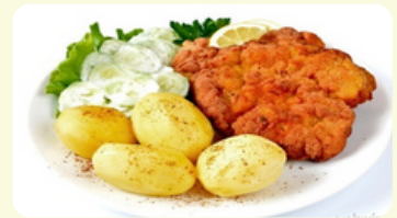
Kotlet schabowy - Milanesa 620 RD

Bañados en salsa pomodoro y acompañado con puré de papas.