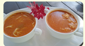
Pomidorowa (de tomate) 365RD con arroz o pasta