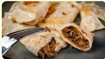
Sauerkraut y mushrooms 555RD

Filled with potatoes and shrimps, served with delicious pink sauce