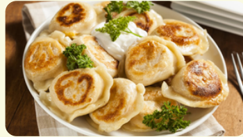
Con carne 555RD

De queso y papa, bañado con cebolla y tocineta. Acompañado con crema agria y ensalada de repollo.