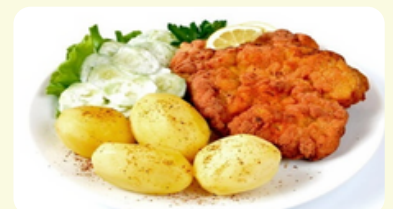
Kotlet Schabowy - Milanesa 620 RD

Ground meat mixed with the rice, served with tomatoes sauce and potatoes.