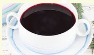
Barszcz na zakwasie- Borsch limpio 275 RD