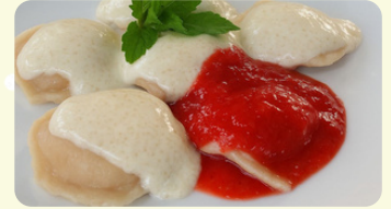
Con fresas 550RD

Servido con cebolla sofrita, crema agria acompañado con ensalada de repollo.