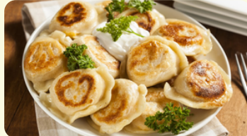
Pierogi with Meat 555RD

White cheese and potatoes, with fried onion and bacon on the top, accompanied with coleslaw salad and sour cream,