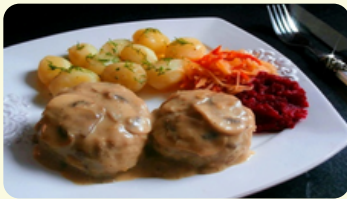
Kotlety Mielone - Albóndigas 555RD

En salsa de champiñones, puré de papa y ensalada de repollo morado.