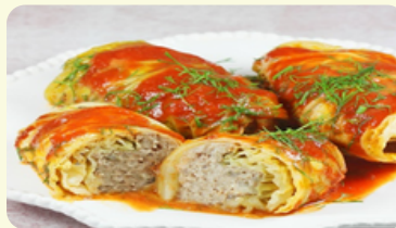
Golabki - Cabbage rolls 595RD

Meatballs with mushroom sauce served with potatoes and red cabbage.