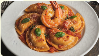
Caribbean Pierogi 795RD

Filled with strawberries, served with sugar and cream. Delicious!