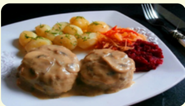
Kotlety Mielone - Meatballs 555RD

Meatballs with mushroom sauce served with potatoes and red cabbage.