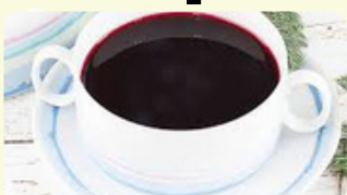
Barszcz na zakwasie 275RD