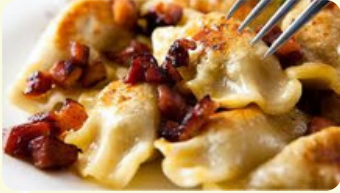
Pierogi Tradicional 550 RD

White cheese and potatoes, with fried onion and bacon on the top, accompanied with coleslaw salad and sour cream,