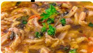
Mondongo Polaco 425 RD Flaki 425 RD